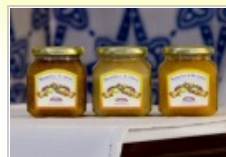
Marmellate di Agrumi